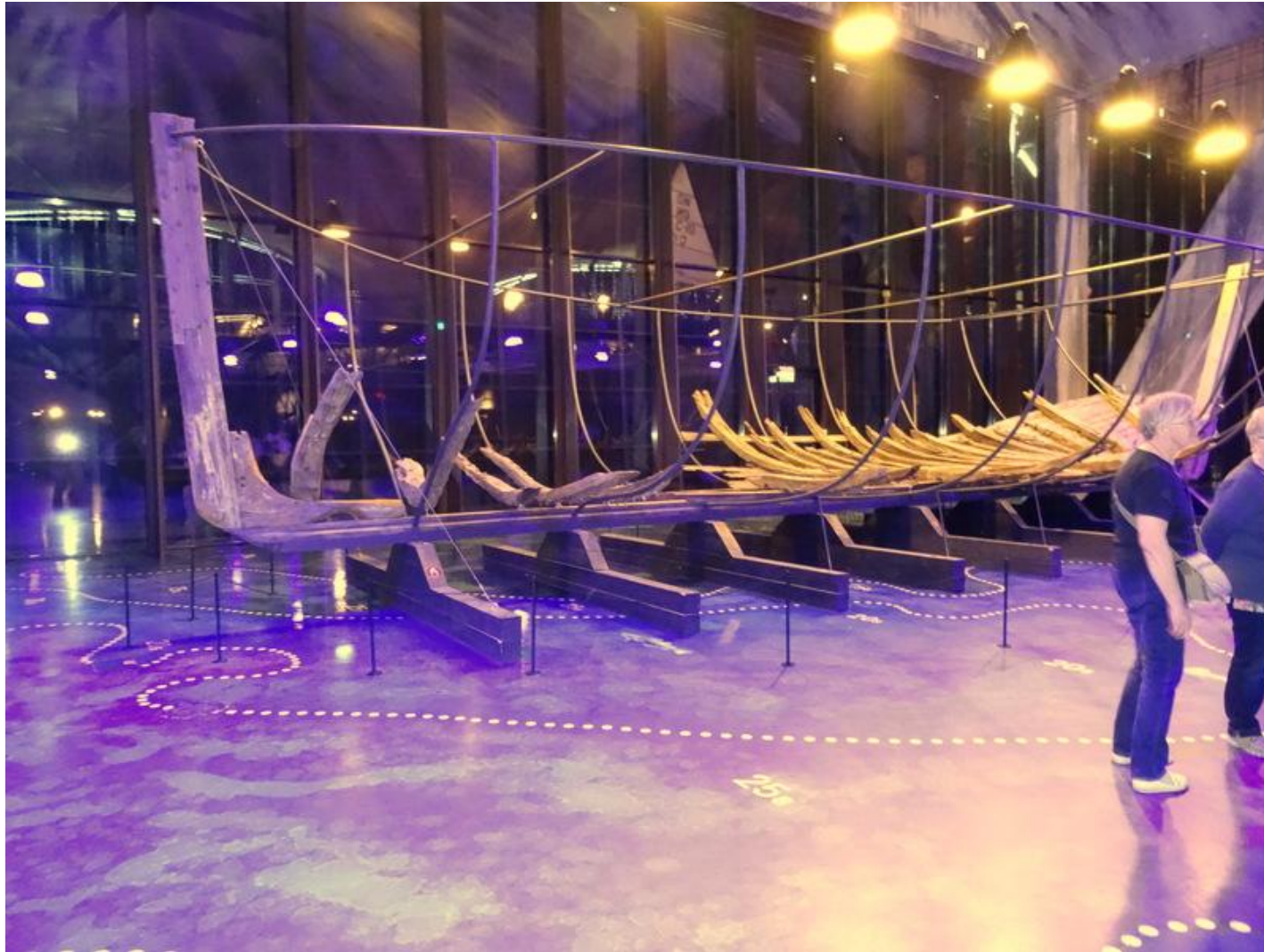
Viikinkilaiva, no luonnos kuitenkin, mutta missä on keulan