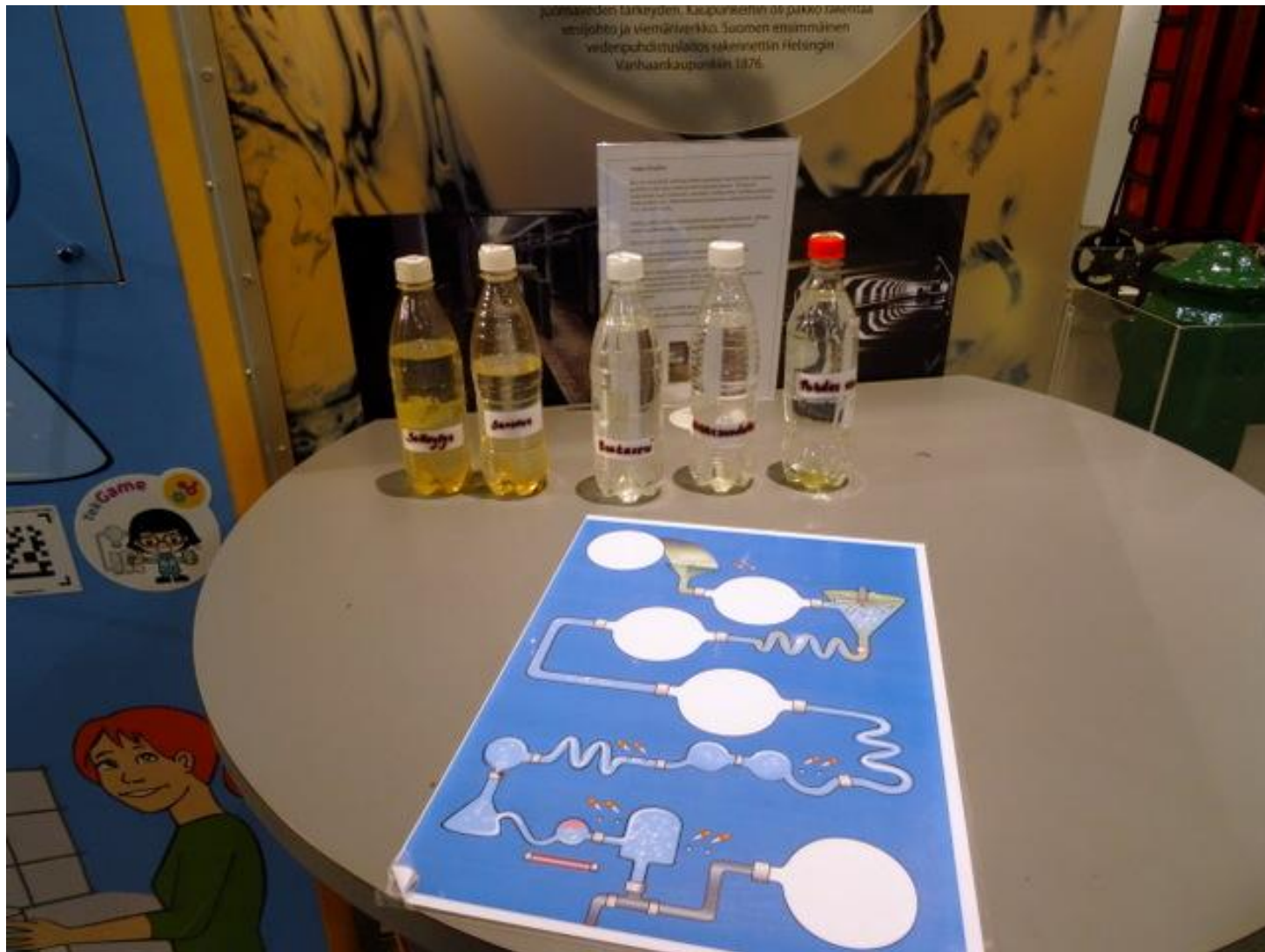
Vesihuolto oli tietysti tärkeää, mutta minkälaista vettä Vantaanjoesta saikaan.