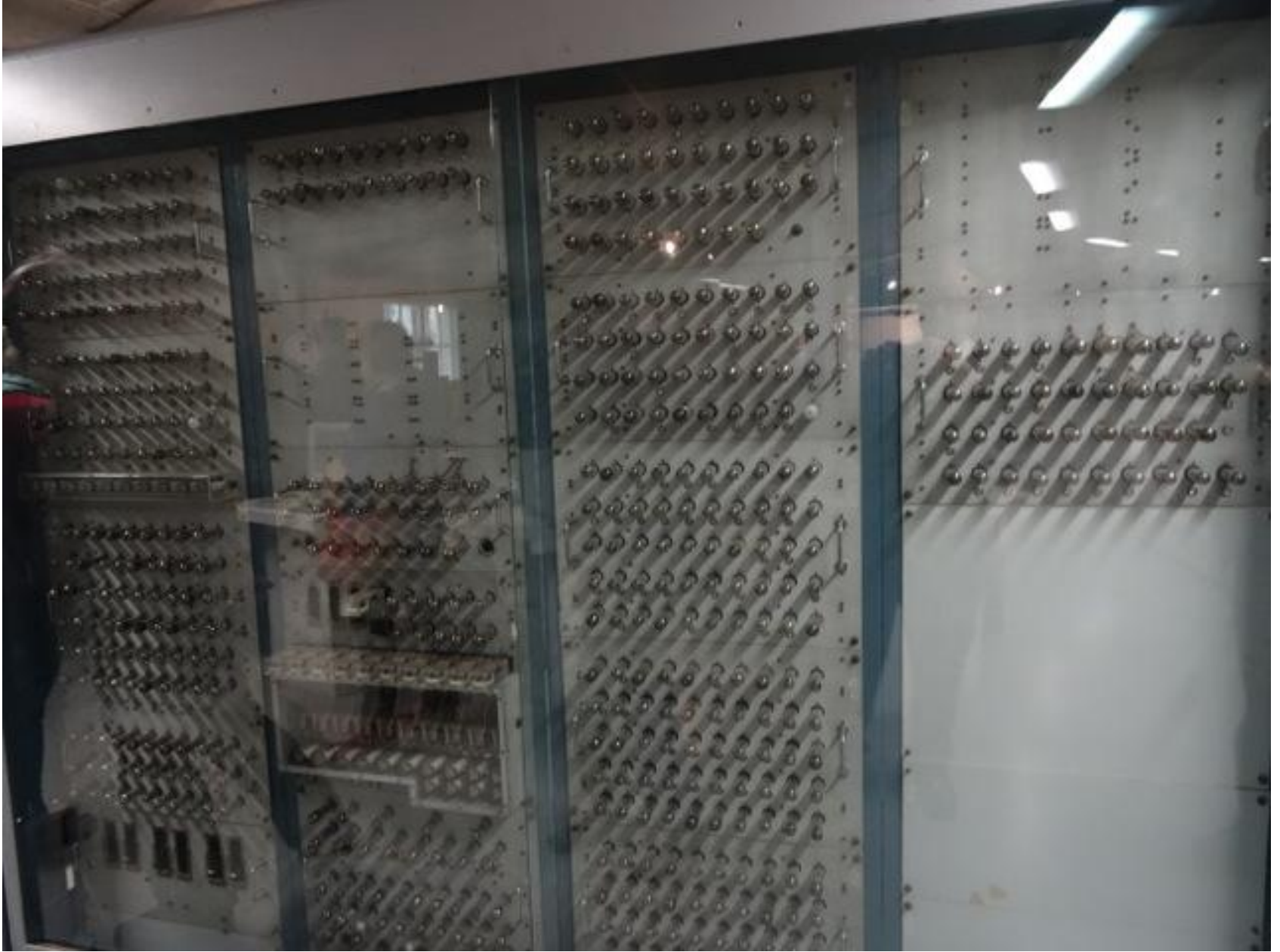
Esko, ensimmäinen Suomessa rakennettu tietokone. Se oli vanha jo syntyessään 1959, sillä Postisäästöpankki hankki IBM 650:n vuonna 1958. Sen nimi oli Ensi.