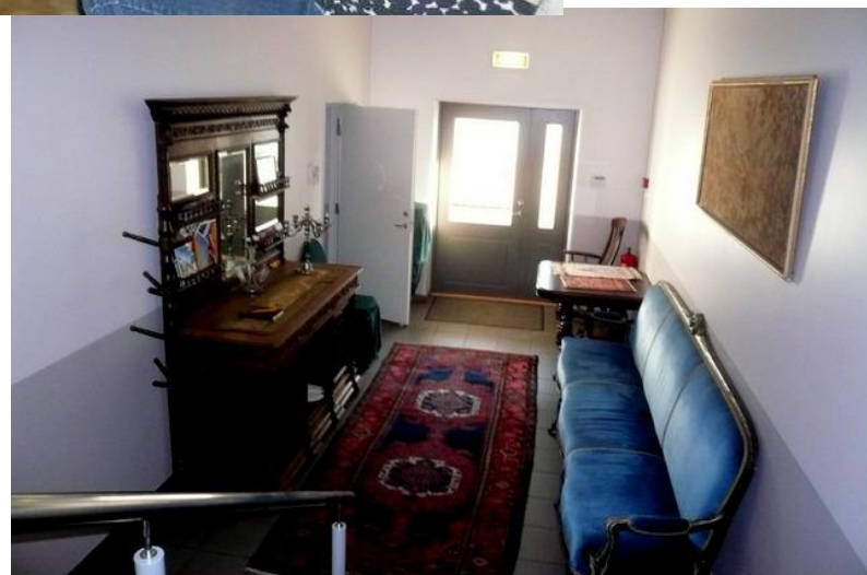
Iltapalan jälkeen lähdemme Sepän majataloon.