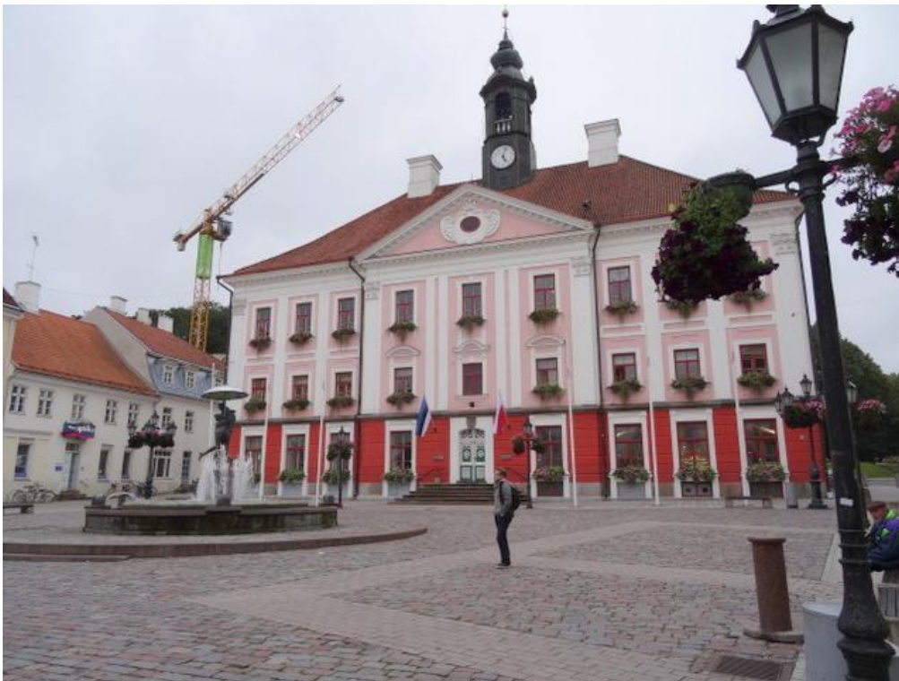
Raatihuoneen tori ja nuoret rakastavaiset