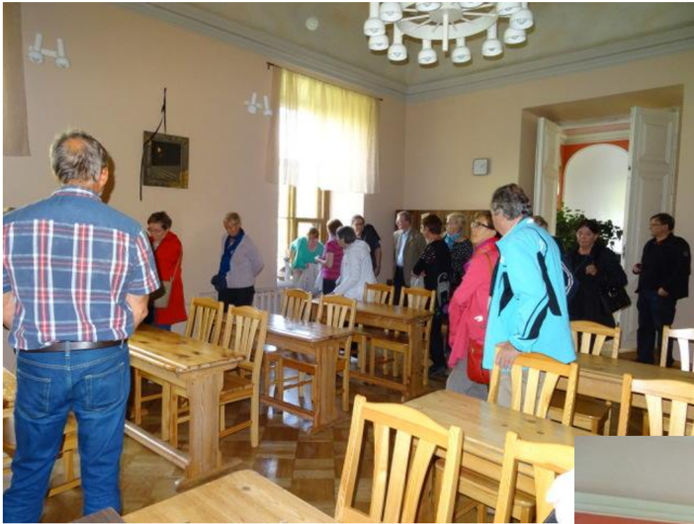
Kouluokka ja rehtori ketomassa kartanon historiasta.