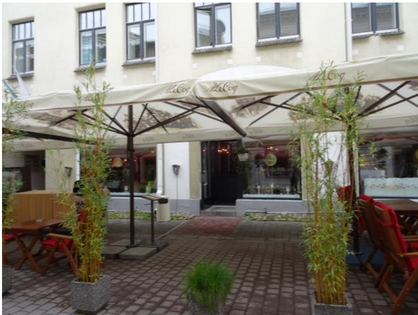
Chez Andre- ravintola- ruokaa, ruokaa huusikin jo moni vatsa.