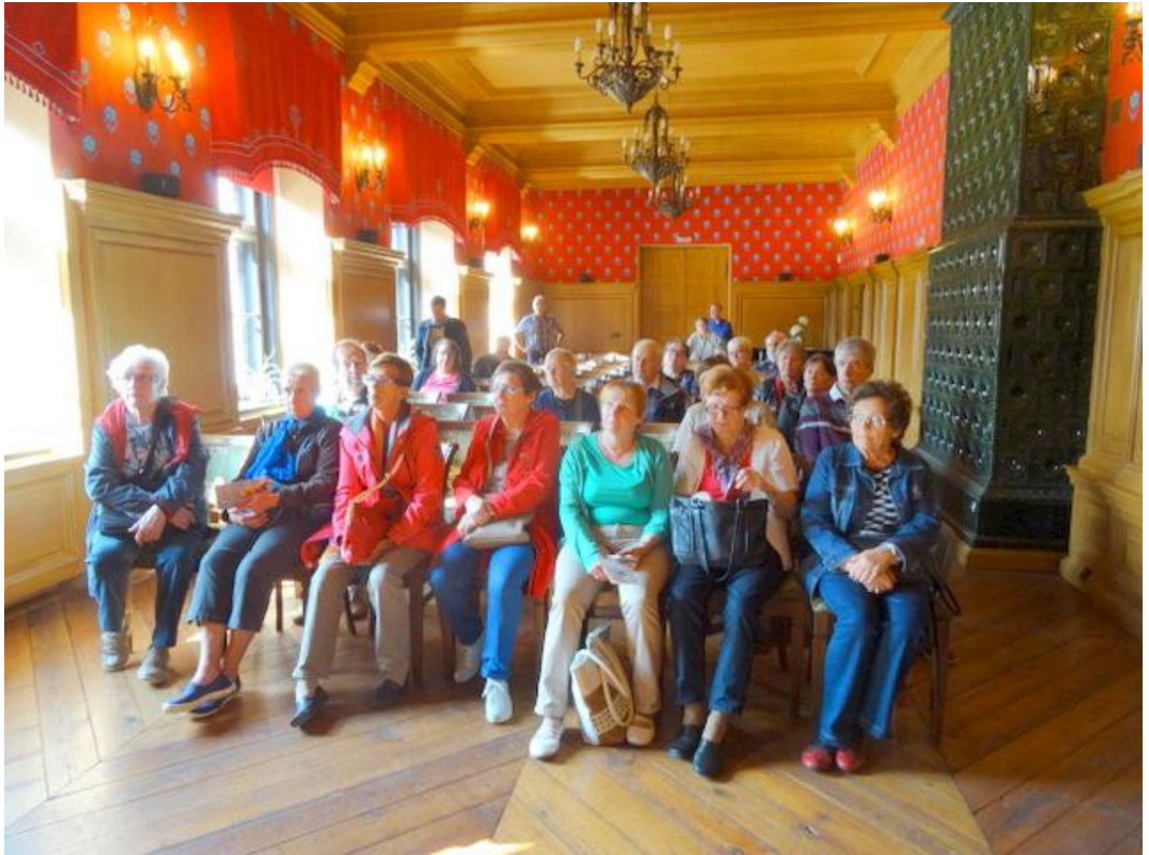
Teleseniorit kuuntelemassa linnan tarinaa.