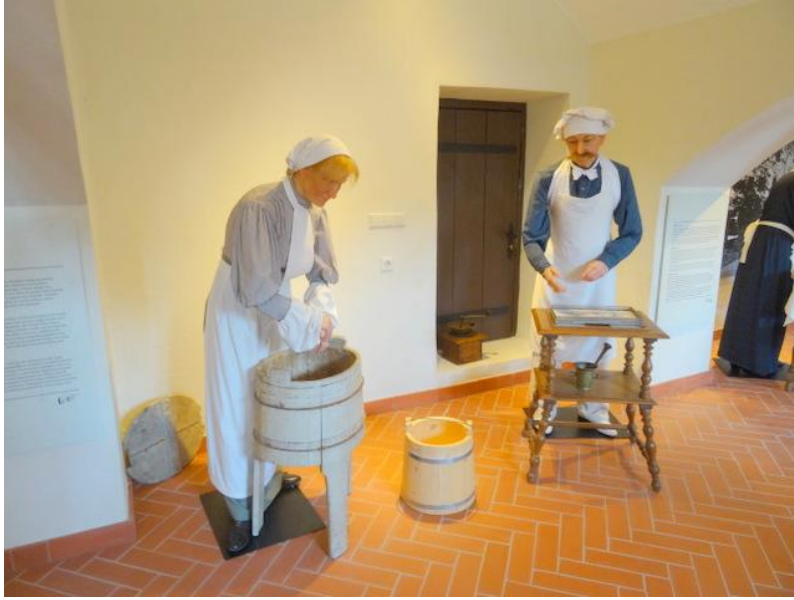
Pesijä, leipuri ja kuka lie liukaskielinen vikittelemässä Tuulaa.