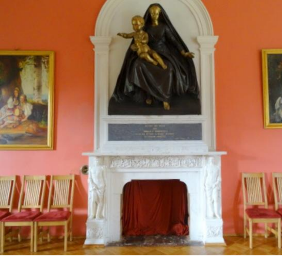
Carl Timoleon von Neffin taideteokset Muugan kartanosta ja Helsingin Tuomiokirkosta.