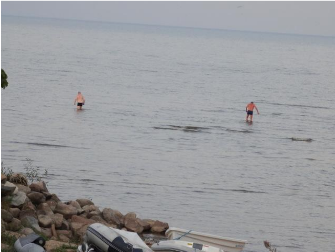
Kaksi urheata urosta kahlassi Peisijärvellä melkein Venäjän puolelle.