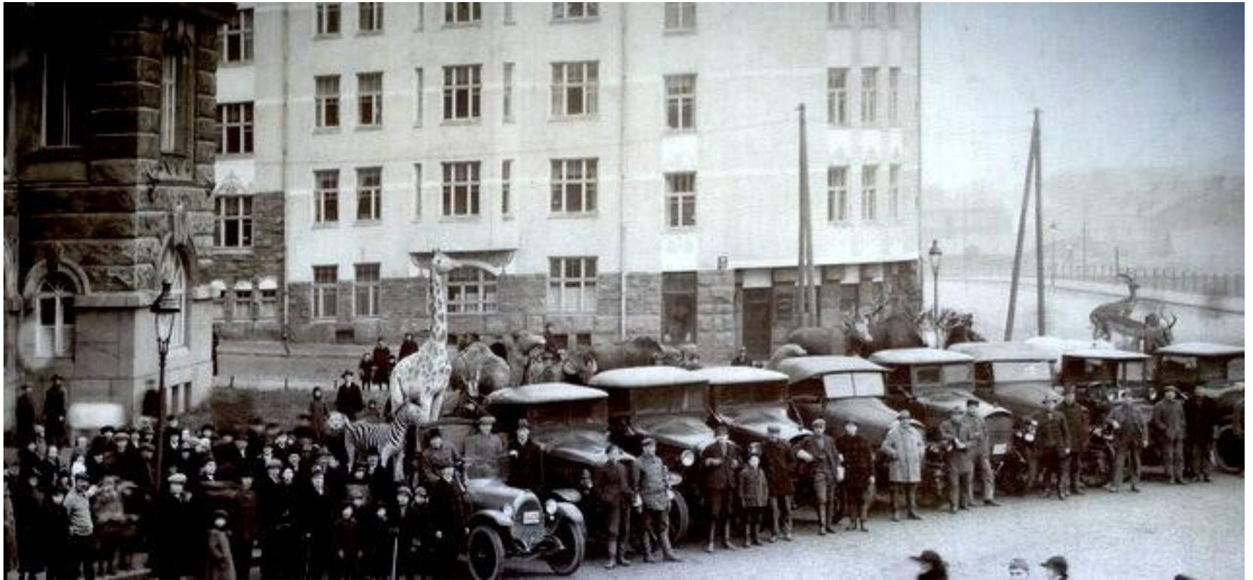
Viktor Ekin autoilla tuotiin kaikki eläinmuseon eläimet tähän taloon.